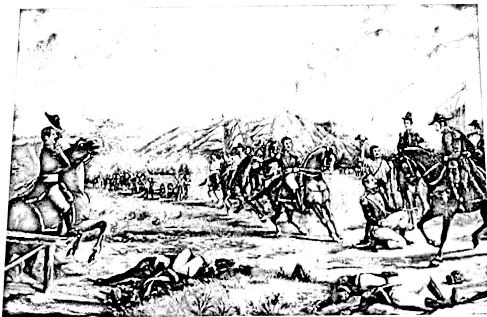
Batalla de Boyacá, Imagen obtenida de : http://mario8a.wordpress.com/imagenes-colombia/

Sí. En el 2019, es decir dentro de cinco años, estaremos conmemorando el Bicentenario de este acontecimiento histórico. La Campaña Libertadora de 1819 fue una insurrección cocinada en el fuego de la opresión pero avivada por el amor terrigeno y el espíritu libertario de sus protagonistas. La contienda fue desigual. Se impusieron los bravos defensores de la independencia, inspirados en los legítimos derechos de igualdad y libertad. Ellos, semidesnudos y mal pertrechados, armados, a cual más, de arrojo, valor y heroísmo se dieron sin condiciones a una causa noble y altruista. Lucharon para defender unas convicciones profundas, heredadas de sus ancestros indígenas y consolidar unos principios sustentados en la dignidad humana que habían inspirado la, por ese entonces, reciente Revolución Francesa.