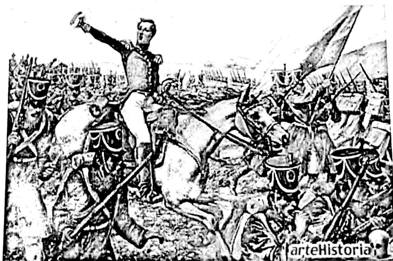
El Mariscal de Ayacucho

se construyó en 1913 el Teatro Municipal, ubicado en la calle 21 entre carreras 10 y 11; en 1917 se inauguró el Parque de los Mártires de Tunja para rememorar el sacrificio de los héroes en el régimen del terror; en 1919, con motivo del Centenario de la Campaña Libertadora se construyeron: el obelisco del Puente de Boyacá, el parque del Bosque de La República y la primera etapa de la antigua plaza de mercado (hoy Plaza Real) en Tunja. Con ocasión del Cuarto Centenario de la fundación hispánica de Tunja, durante el gobierno del presidente Eduardo Santos Montejó, se realizaron las siguientes obras: Teatro Cultural, segunda Etapa de la antigua Plaza de Mercado (Plaza Real); Edificio Nacional, inmueble que se demolió y en su lugar se construyó la actual sede de la DIAN en la Plaza de Bolívar; Hotel Centenario, edificación que se demolió para construir la sede de la caja de Compensación Familiar de Boyacá; el Batallón Bolívar; la planta física de la Escuela Normal Superior, actualmente es la sede central de la Universidad Pedagógica y Tecnológica de Colombia; se erigió un complejo monumental en el Puente de Boyacá, destacándose entre estos el monumento al Libertador Bolívar del escultor alemán Ferdinand Von Miller.